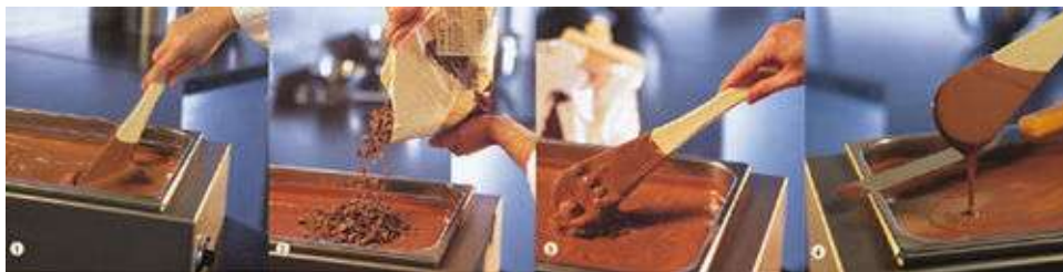
Impfen von Kuvertuere